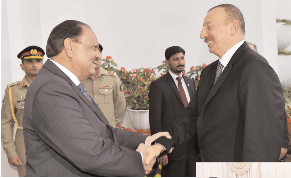
Əvvəli Səh. 2

Prezident İlham Əliyev Pakistan İslam Respublikasına səfər edib