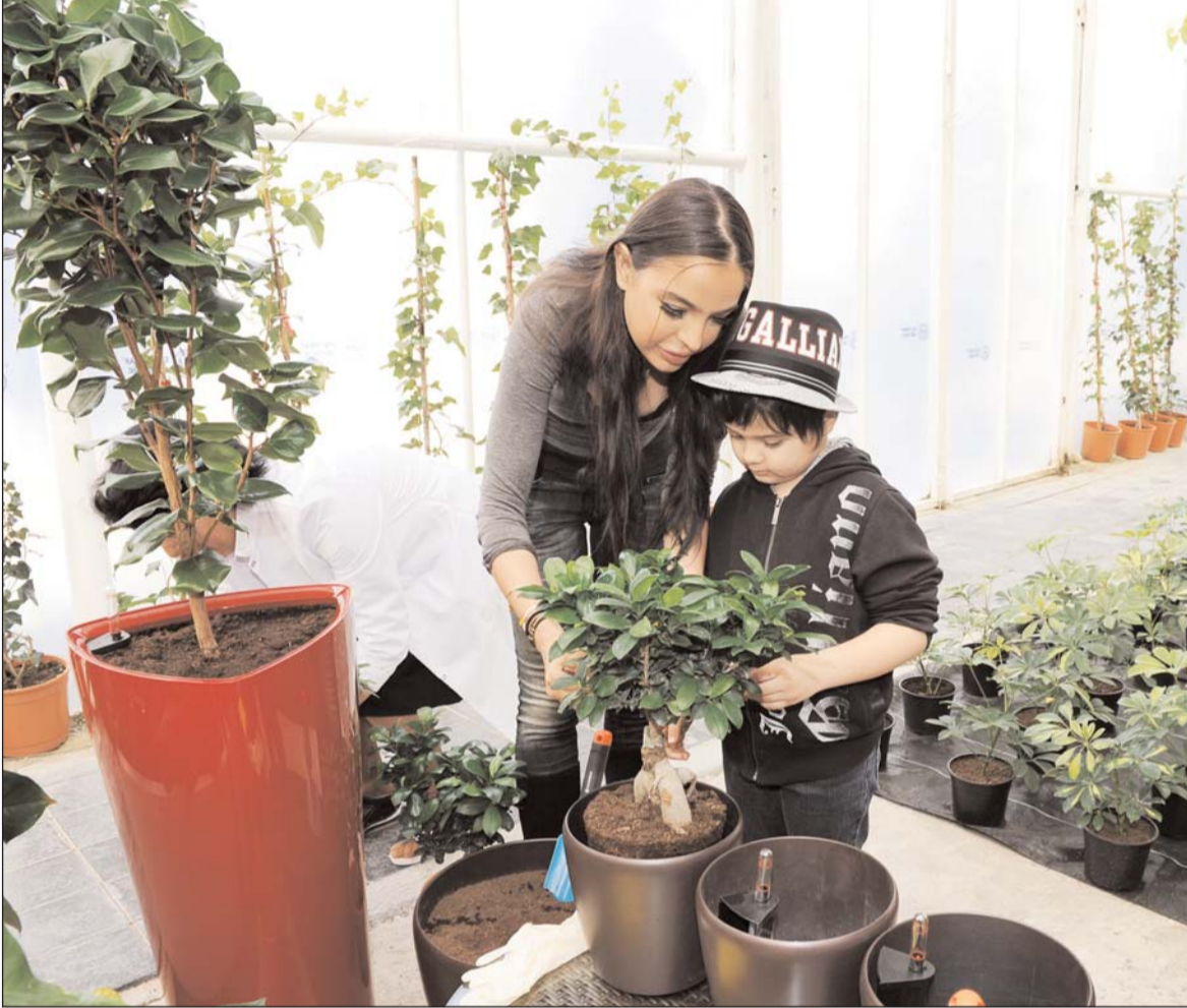
Əvvəli Səh. 5