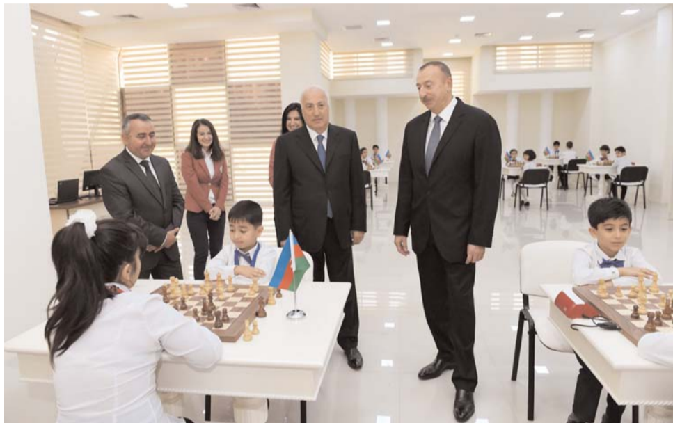
Əvvəlki Səh. 3

“Bu etimad bizə güc verir. Bu etimad olmasaydı, ölkəmizin milli maraqlarını beynəlxalq müstəvidə müdafiə etmək çətin olardı”