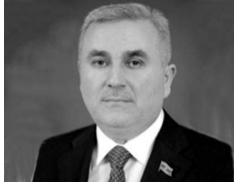
NƏRİMAN ƏLİYEV, Milli Məclisin deputatı

H əyata keçirilən demokratikləşmə prosesində, xalq-hakimiyyət birliyi əsas aparıcı qüvvə olmaqla, vətəndaş cəmiyyəti quruculuğu prosesinə daima öz müsbət töhfəsini verməkdədir. Respublikamızda qanunvericilik bazasının təkmilləşdirilməsi, icra mexanizmlərinin tənzimlənməsi, çoxpartiyalı sistemin inkişaf etdirilməsi, insanlara sərbəst toplaşmaq azadlıqlarının verilməsi Azərbaycan demokratiyasının davamlı inkişafından xəbər verir. Bu gün müstəqil Azərbaycan öz siyasətini, məhz möhkəm təməllər üzərində qurmuşdur.