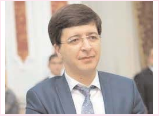
Müsaibimiz Demokratik Maarifçilik Partiyasının sədri, millət vəkili Elşən Musayevdir