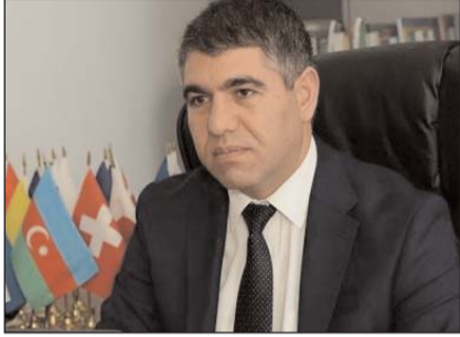
dirma ilə bağlı fikriniz necədir?

- Sözügedən şəbəkənin Azərbaycanla bağlı öncələri də “araşdırmaları” olub. Bu insident real durumu və marağı ortalığa qoydu. Məqalədə mənə aid sitat kimi təqdim edilən fikir və cümlələr jurnalist təxəyyülü məhsulundan başqa bir şey deyil. Mənimlə əlaqə saxlanılmayıb, mövzu ilə bağlı fikrim öyrənilməyib. Məqalənin daxilində heç bir istinad görmədik. Belə olan halda, jurnalist-araşdırmaçı öz təxəyyülünün gücünə qüvvət verərək, İSİM və onun rəhbəri adından istədiyi məzmunu öz araşdırmasına əlavə edir, ictimailəşdirir. Araşdırma zamanı edilən belə səhvlər ümumilikdə “Organized Crime and Corruption Report Project (OCCRP)” əməkdaşlarının araşdırma aparmaq qabiliyyətlərinin və onların əvvəlki araşdırmalarının keyfiyyətini ciddi şübhə altına almağa imkan verir.