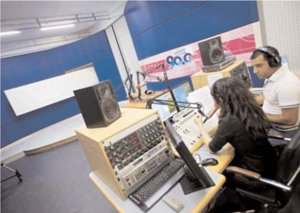
Əvvəli Səh. 5