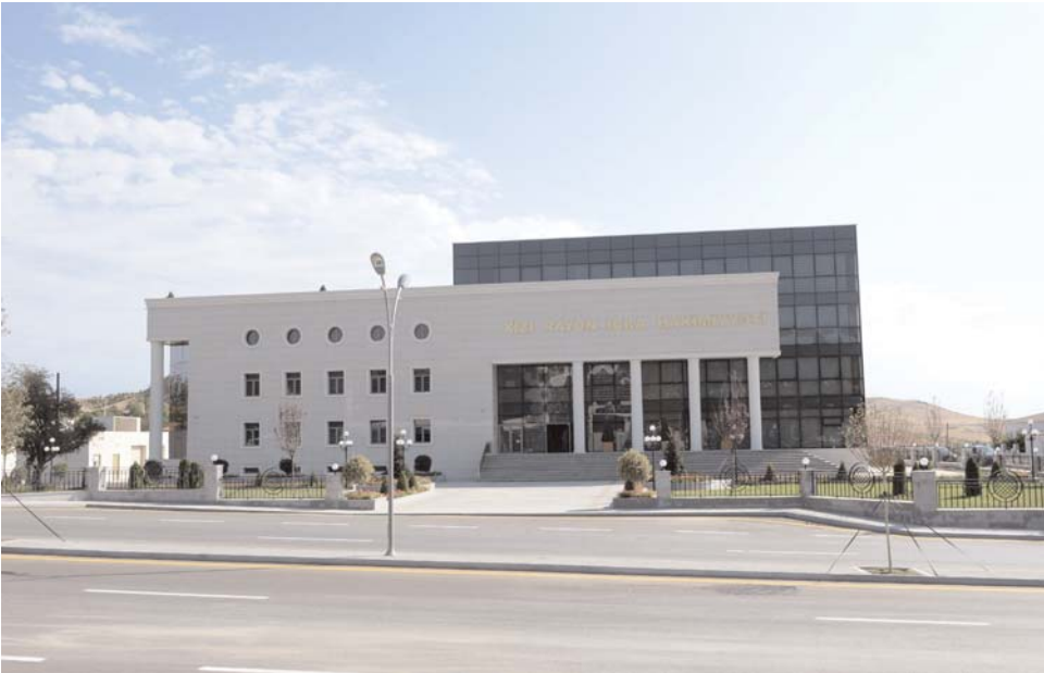
Əvvəli səh. 3