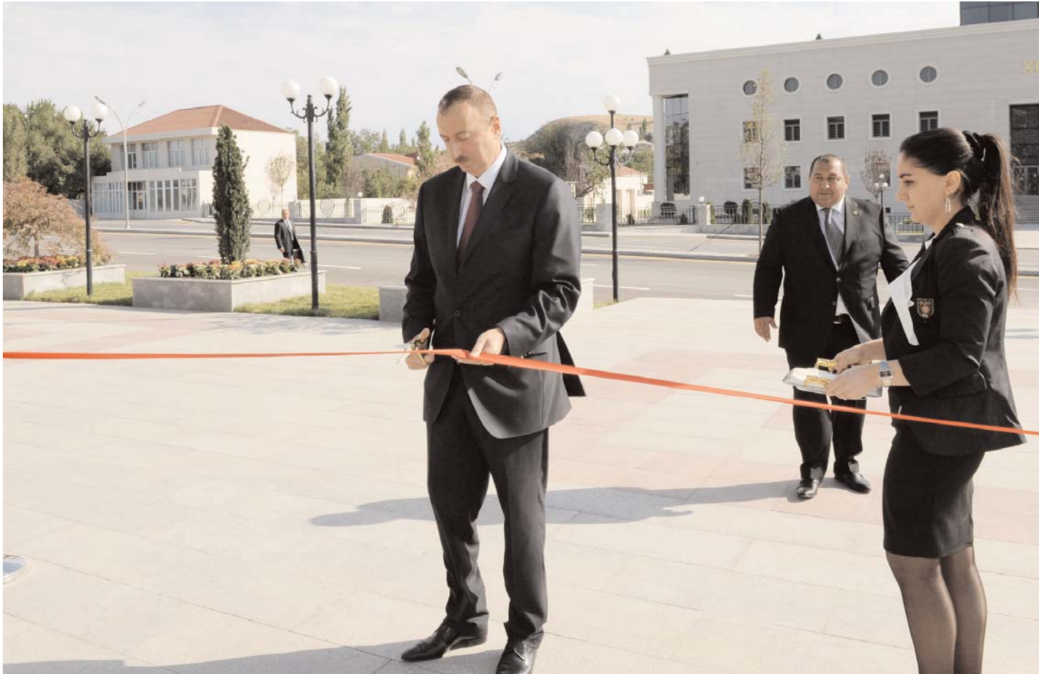
Əvvəli səh. 2

Mərkəzin tikintisində şəhərsalma məmarlığının son nailiyyətlərindən istifadə olunub. Burada sərgi salonu, kafe, istirahət və digər yardımçı otaqlar var. Açıq sərgi salonunda maraqlı rəsm nümunələri sərgilənir. Mərkəzdə elektron kitabxana, kulinariya, xalq sənətkarlığı emalatxanası, musiqi və heykəltəraşlıq dərnəkləri fəaliyyət göstərəcəkdir. Bu dərnəklər gənclərin müxtəlif sənətlərin sirlərinə yiyələnməsinə, onların asudə vaxtının səmərəli təşkilinə geniş imkanlar yaradır. Mərkəzdəki kompyuter otağı, rəsm və dizayn studiyaları, virtual sinif də müasirliyi ilə diqqəti cəlb edir. Burada rayonun ictimai-siyasi həyatında baş verən mühüm hadisələr və əlamətdar günlərlə bağlı tədbirləri yüksək səviyyədə keçirmək üçün hərtərəfli imkan yaradılıb. Mərkəzdəki 230 yerlik akt və kiçik konfrans zallarında ictimai-siyasi və mədəni-kütləvi tədbirlərin, o cümlədən ulu öndər Heydər Əliyevin zəngin irsinin geniş təbliği məqsədilə açıq dərslərin keçirilməsi nəzərdə tutulub. Buraya gələnlər 3D kino zalından, pnevmatik tirzallarından istifadə edə bilərlər.