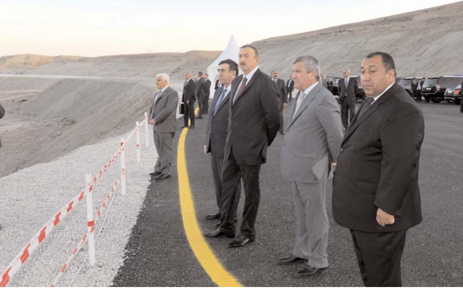
Əvvəli səh. 4

Azərbaycan Prezidentinə parkda aparılan abadlıq-quruculuq işləri barədə ətraflı məlumat verildi. Bildirildi ki, ümumi sahəsi 5800 kvadratmetr olan parkda sakinlərin istirahəti üçün hərtərəfli şərait yaradılıb, geniş yaşıllıq zolağı salınıb. Parkda aparılan yenidənqurma işləri zamanı ən xırda detallar da nəzərə alınıb. Bunun nəticəsidir ki, park Xızının ən gözəl və görkəmli yerlərindən birinə çevrilib. Burada yaradılan şərait həm də ümumilikdə rayonda aparılan abadlıq-quruculuq işlərinin həcmi aydın göstərir. Azərbaycan teatr sənətinin inkişafında böyük xidmətləri olmuş, görkəmli dramaturq Cəfər Cabbarlının adını daşıyan bu parkda yaradılan şərait istər rayon sakinlərinin, istərsə də Xızıya gələn qonaqların istirahətinin mənalı təşkili üçün geniş imkanlar açır.