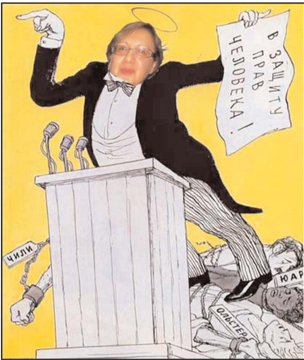
vacibliyindən dəm vurub.